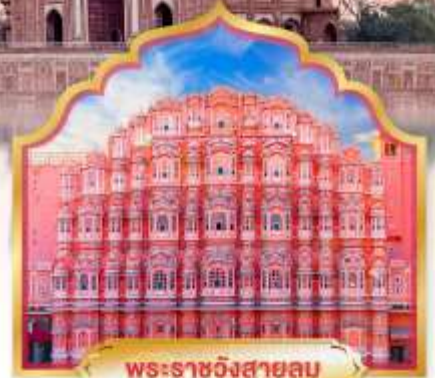
พระราชวังสายลม