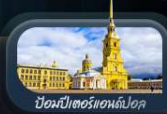
ปีอปปิเตอร์แอนดปอล