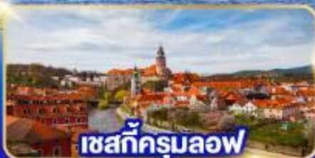
เชสกีครุมลอฟ