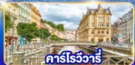
คาร์ลโรวารี