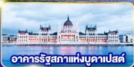
อาคารรัฐสภาแห่งบูดาเปสต์