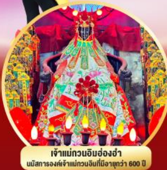
เจ้าแม่ทวนอิมฮ่องกง นมัสการองค์เจ้าแม่ทวนอิมที่มีอายุกว่า 600 ปี