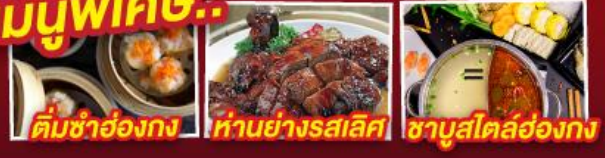
ติ่มซำฮ่องกง ห่านย่างรสเลิศ ซาซุสโตลล์ฮ่องกง