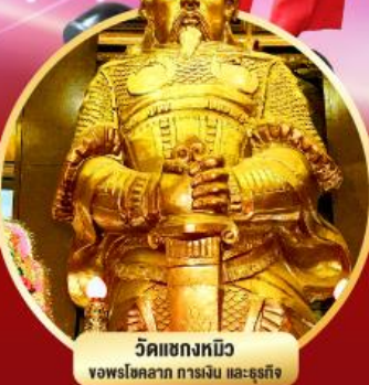
วัดแชกงหมิว ขอพรโชคลาภ การเงิน และธุรกิจ