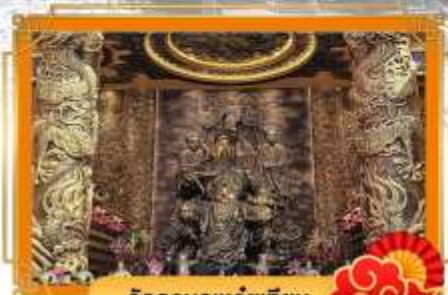
วัดกวนอูเหวยเทียน