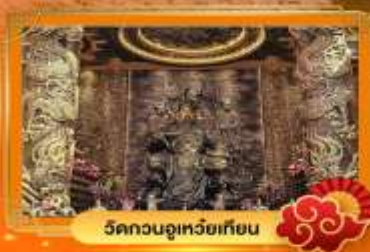
วัดกวนอู๋เหว่ยเทียน