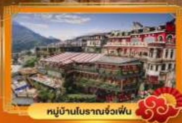
หมู่บ้านโบราณจ้วเฟิ่น