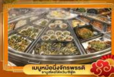
เมนูหม้อไฟจักรพรรดิ