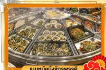
เมฆหมอกนึ่งจักรพรรดิ