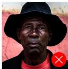
Back side is colored