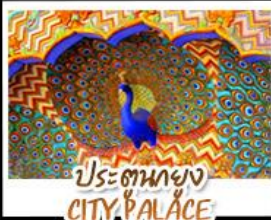
ประตูทอง CITY PALACE