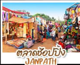
ตลาดช้อปปิ้ง JANPATH