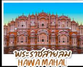
พระราชสาลม HAWA MAHAL