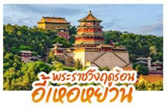
พระราชวังฤดูร้อน อู่เต๋อเฉยวัน