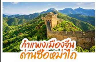
กำแพงเมืองจีน ด่านซือหม่าโต

มรดกโลกสุดยิ่งใหญ่ ใจกลางกรุงปักกิ่ง พระราชวังต้องห้าม (กู้กง) สัมผัสประสบการณ์ขึ้นกำแพงเมืองจีน ด่านซือหม่าโต (รวมกระเช้าขึ้น-ลง) • ซ้อปิงกบนหวิ่งฝูจิ่ง และซานหลี่กุน