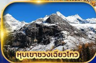
หุบเขาขวงเฉียวโกว