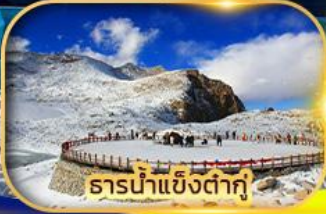
ธารน้ำแข็งต่ากู่