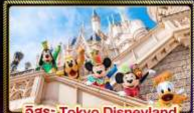
อิสระ Tokyo Disneyland