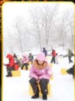
ตกปลาน้ำแข็ง