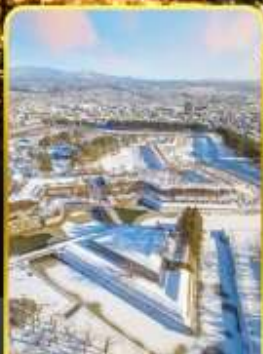
หอดาวห้าแฉก

ออนเซ็น 3 คั้น มน.กระเป๋า 1 ใบ 23 กก 7Days 5Night