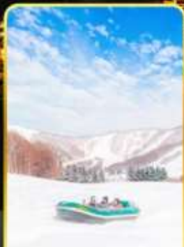
กิจกรรมสโนว์ราฟติง