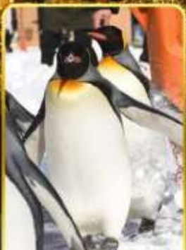
บิกชามารีนพาร์ค