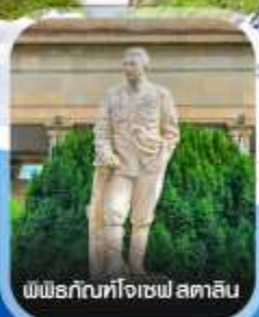
พิพิธภัณฑ์ทองเฟ สตาซิน