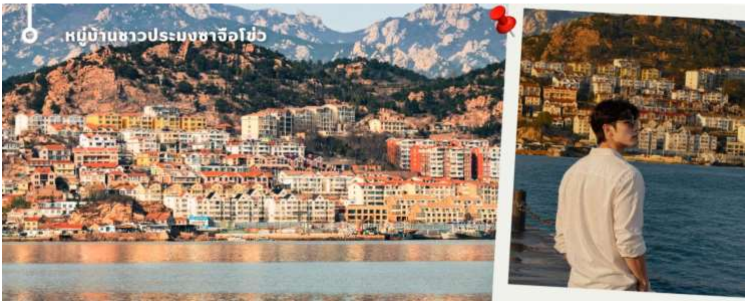
หมู่บ้านชาวประมงซาโจโซว

เจียบสงบของภูเขาและทะเล พร้อมเลือกซื้ออาหารทะเลสดใหม่ และเก็บภาพความประทับใจกับหนึ่งในแลนด์มาร์กยอดนิยมของชิงเต่า