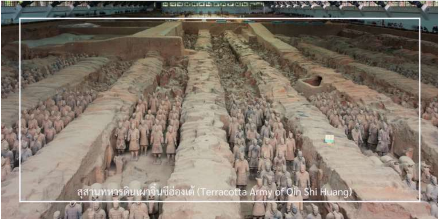
สุสานทหารดินเผาจีนซีฮ่องเต้ (Terracotta Army of Qin Shi Huang)

นำท่านเดินทางสู่ สุสานทหารดินเผาจีนซีฮ่องเต้ (Terracotta Army of Qin Shi Huang) หนึ่งในสิ่งมหัศจรรย์ของโลก ยุคโบราณและแหล่งโบราณคดีที่สำคัญที่สุดของจีน ตั้งอยู่ใกล้เมืองซีอาน มณฑลส่านซี ค้นพบโดยบังเอิญในปี ค.ศ. 1974 ก่อนจะได้รับการขุดค้นเป็นมรดกโลกโดยยูเนสโกในปี ค.ศ. 1987 สุสานแห่งนี้คือสถานที่ฝังพระศพของ “ จีนซีฮ่องเต้ ” จักรพรรดิองค์แรกของจีนผู้รวบรวมแผ่นดินเป็นหนึ่งเดียวในยุคราชวงศ์ฉิน ครอบคลุมพื้นที่หลายหมื่นตาราง เมตร แบ่งเป็น 3 หลุม ซึ่งภายในมีทหารดินเผากว่า 8,000 ตัว ที่ถูกสร้างขึ้นอย่างประณีต มีใบหน้า ท่าทาง และเครื่องแต่งกายแตกต่างกันไป พร้อมด้วยรถศึก ม้า และอาวุธโบราณ ที่วางเรียงรายอย่างเป็นระเบียบในหลุมฝังศพ เพื่อปกป้อง จักรพรรดิในชีวิตหลังความตาย