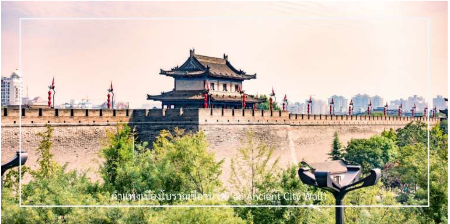
กำแพงเมืองโบราณซีอาน (Xi'an Ancient City Wall)

นำท่านขึ้นชม กำแพงเมืองโบราณซีอาน (Xi'an Ancient City Wall) อีกหนึ่งกำแพงเมืองโบราณเก่าแก่และสมบูรณ์ที่สุดของจีน สร้างขึ้นในสมัยราชวงศ์หมิงเมื่อกว่า 600 ปีก่อน มีความยาวโดยรอบประมาณ 13.7 กิโลเมตร กว้าง 12-14 เมตร และสูงราว 12 เมตร ออกแบบอย่างแข็งแกร่งเพื่อการป้องกันเมือง โดยมีป้อม ประตูเมือง และคูน้ำล้อมรอบ ปัจจุบันกลายเป็นแหล่งท่องเที่ยวยอดนิยม นักท่องเที่ยวสามารถเดินเล่นหรือปั่นจักรยานบนกำแพง เพื่อชมทัศนียภาพของเมืองซีอานทั้งภายในและภายนอกเขตกำแพงได้อย่างชัดเจน