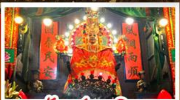
วัดเข้งงเมิว