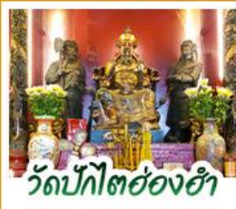
วัดปึกโตย่องฮำ