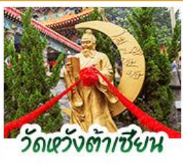
วัดเซ่งเต้าเซิน