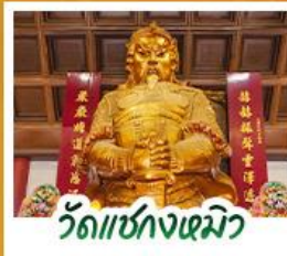
วัดเซกตงหิว