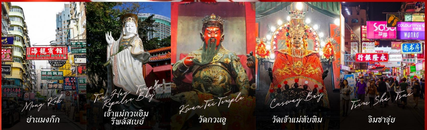
Mong Kok ย่านมงก๊ก

รายการทัวร์ข้างต้นอาจมีการปรับเปลี่ยนเพื่อความเหมาะสม