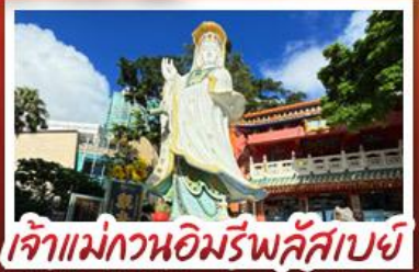
เจ้าแม่กวนอิมรัฟัสเบย์