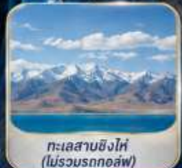
ทะเลสาบชิงไห่ (ไม่รวมรถกอล์ฟ)