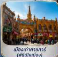
เมืองเก่าคาซการ์ (พิธีเปิดเมือง)