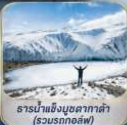
ธารน้ำแข็งมูซตาคาดา (รวมรถกอล์ฟ)