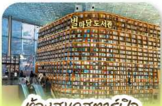
ห้องสมุดสตาร์ฟิช

เก็บทุกไฮไลท์ ในกรุงโซล ตั้งแต่ความงดงามของ พระราชวังเคียงบ็อก ชมวิวสุดอลังการที่ ด็อกซ็อดแด่ โซลสกาย (รวมค่าลิฟต์ขึ้นดึก) สนุกสุดมันส์ที่ สวนสนุกล็อตเต้ เวิร์ด (รวมค่าบัตรเครื่องเล่น) เพลิดเพลินไปกับโลกใต้ทะเล สัตว์ตึก อควาเรียม (รวมค่าบัตรเข้าชม) เช็กอินแลนด์มาร์กสุดฮิตอย่างห้องสมุดสตาร์ฟิช ไคอกรมอลล์ เดินเล่นย่านฮอป บรู๊กลินเกาหลี ซองชูดง และช้อปปิ้งซัมเมอร์ซอล สุดฟิน ย่านเมียงดงและฮงแด