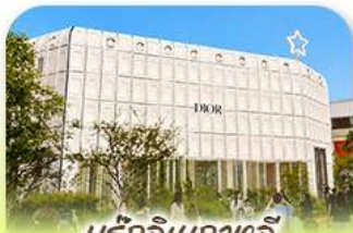
บรู๊กลินเกาหลี