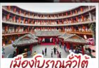
เมืองโบราณลั่วใต้