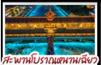
สะพานโบราณหนวยเถียว

อุทยานต้ากู่ปิงชว่น - อุทยานสี่ตรุณี - หมี่แพนด้าเซลฟี่ ป่าฟิโนโตติกSKP - อุทยานปี้เฉิงโกว - สะพานโบราณหนวยเถียว สตรีทอาร์ต Eastern Suburb Memory - เมืองโบราณลั่วใต้ เบมูพิศข ม้าอโฟพมาล่า