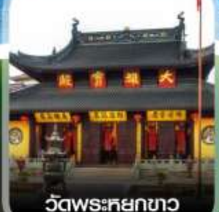
วัดพระศยกขาว