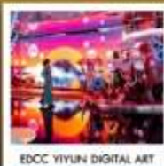
EDCC YIYUN DIGITAL ART