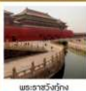
พระราชวังปักกิ่ง