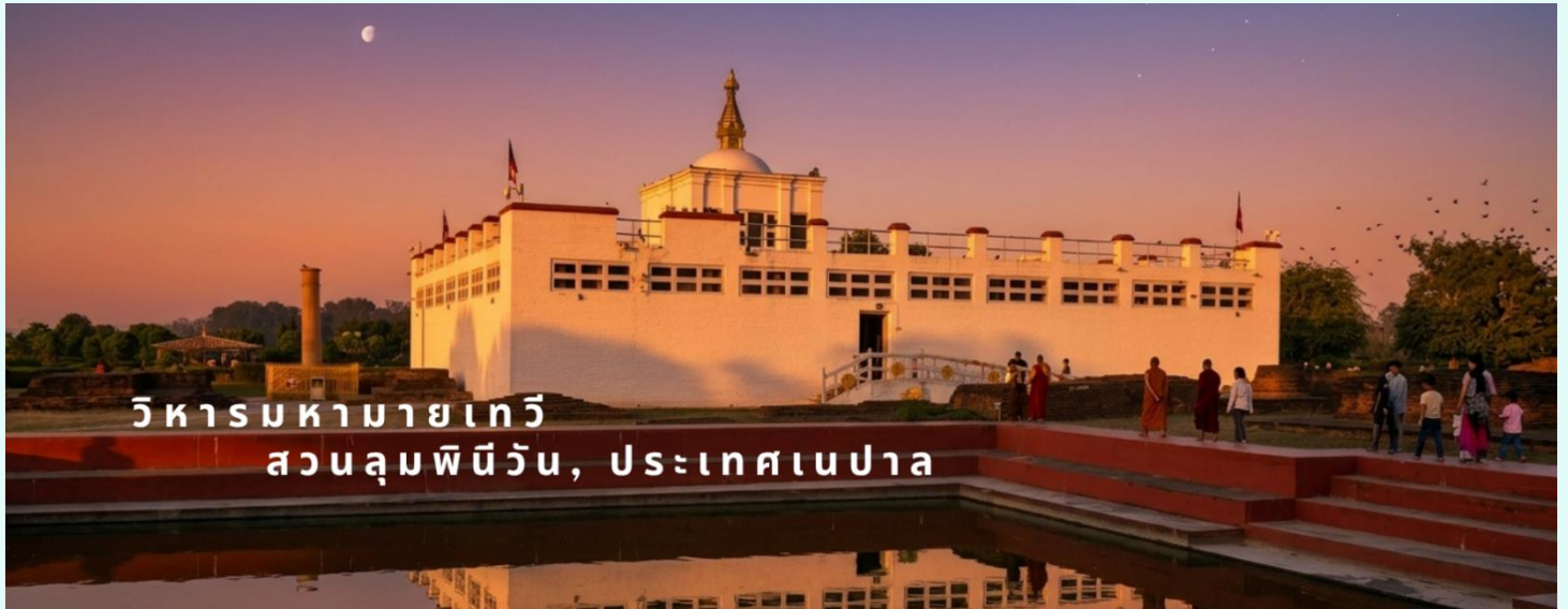
วิหารมหายาเทวี สวนลุมพินีวัน, ประเทศเนปาล

ด้านในวิหารมหายาเทวีไม่อนุญาตให้บันทึกภาพ แต่โดยรอบสวนลุมพินีวัน สามารถถ่ายรูปได้ โดยมีค่าธรรมเนียมกล้องดังนี้ กล้องถ่ายรูปธรรมดา ไม่เสีย กล้องวีดีโอ 10 USD / 800 รูปีอินเดีย / 400 บาท