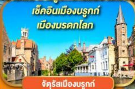
จัตุรัสเมืองบรูกซ์