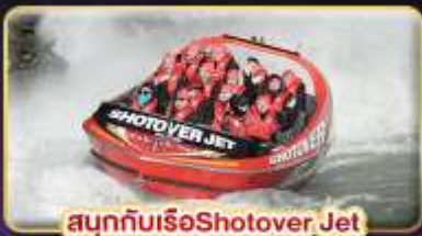
สนุกกับเรือ Shotover Jet