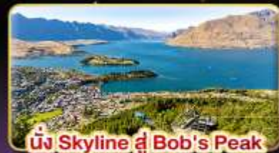
นั่ง Skyline ที่ Bob's Peak