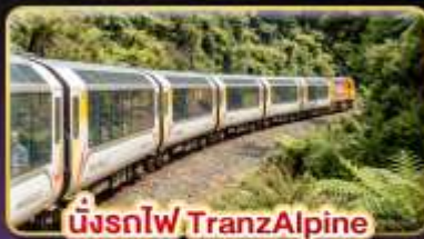
นั่งรถไฟ TranzAlpine