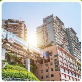
รถไฟทะลุถ้ำ

ไฮไลท์! เมืองโบราณกลางถ้ำ ล่องเรือแม่น้ำอูเจียง อุทยานเกาอาหยวน รถไฟทะลุถ้ำ หมู่บ้านโบราณฉือซื่อซิว ถนนคนเดินเรียวฟางเปี่ย