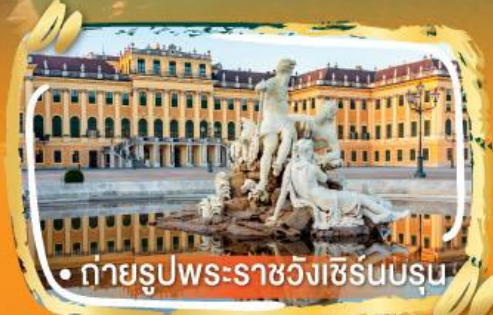
• ถ่ายรูปพระราชวังเชิร์นบรุน