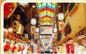
ตลาดปลาชิชิ