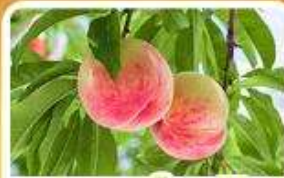
กิจกรรมเก็บผลไม้