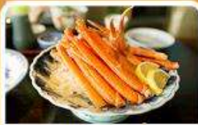
พิเศษ! ขาปู