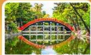
ศาลเจ้าสุมิโยชิ โกเบ