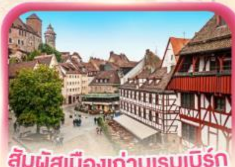
สัมผัสเมืองเก่าบูร์กุนดี