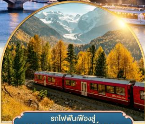
รถไฟฟันเฟืองสู่ ยอดเขากรอนเนอร์เกรต