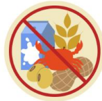
● แพ้อาหาร / อื่นๆโปรดระบุ