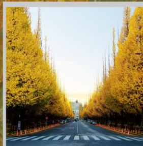
"ICHONAMIKI GINGO AVENUE"