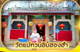
วัดแม่กวนอิมสองห้า