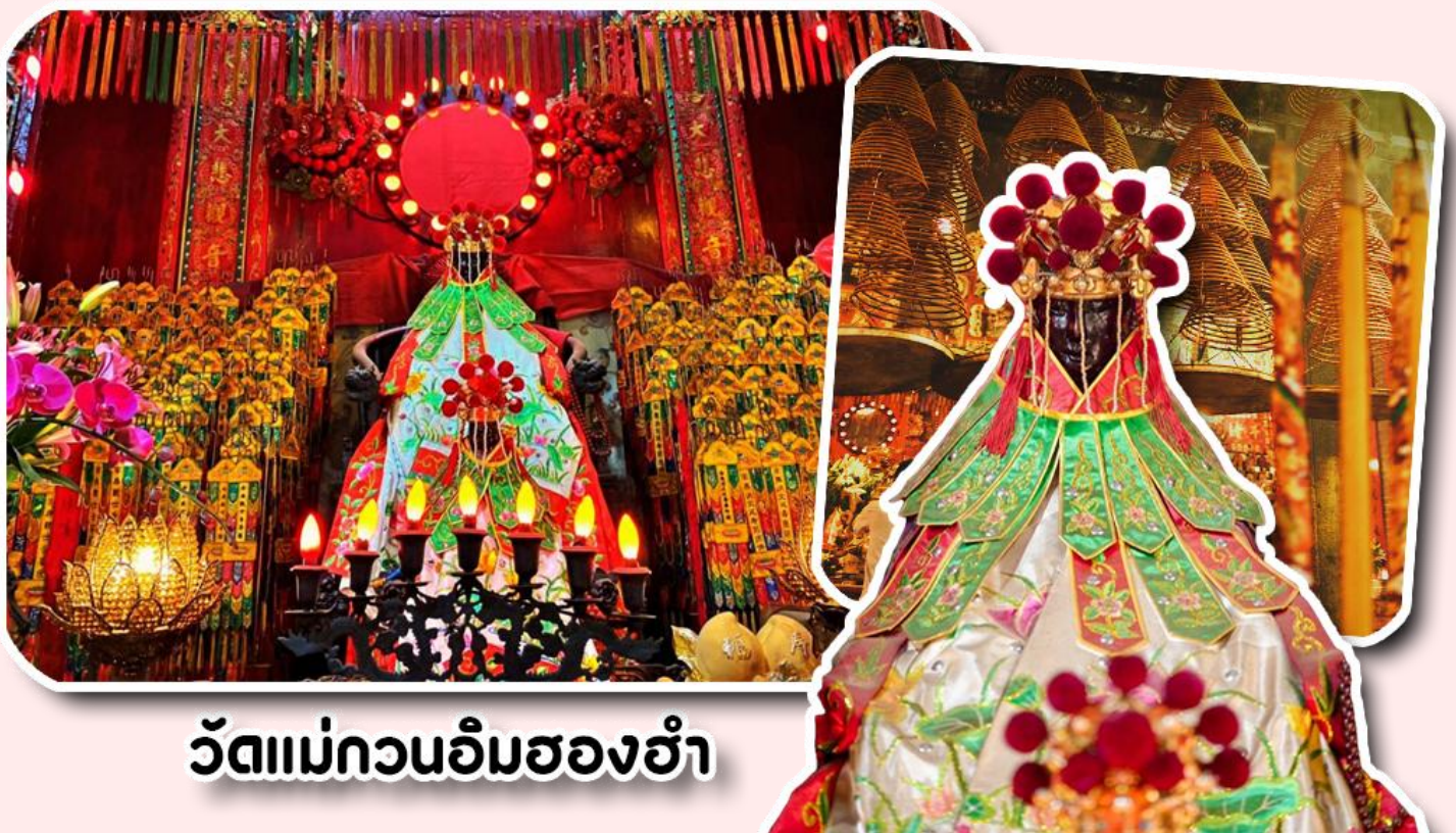
วัดแม่กวนอิมฮ่องกง

1873 เป็นวัดขนาดเล็กที่มีชาวฮ่องกงศรัทธาแน่นถือกันเป็นอย่างมาก วัดแห่งนี้เป็นที่ประดิษฐาน องค์เจ้าแม่กวนอิมฮ่องกง ที่มีชื่อเสียงเรื่องการให้กู้ยืมเงิน เชื่อกันว่าท่านช่วยพลิกฟื้นเศรษฐกิจของชาวฮ่องกง ผู้คนจึงนิยมมาเยี่ยมเงินทำธุรกิจจนสำเร็จร่ำรวย รุ่งเรือง โดยให้ท่านอธิษฐานขอพรต่อหน้าเจ้าแม่กวนอิมฮ่องกง พร้อมกับระบุวันเวลาในการขอพรด้วย จากนั้นนำธูปตามฐานะและศรัทธาที่เราจะนำเป็นสื่อในการขอพร เขียนจำนวนเงินที่ต้องการลงไปด้วย ใสสกุลเงินยิ่งดีใหญ่ แล้วนำเงินใส่ในซองแดง ควรเตรียมซองแดงไปเอง นำซองแดงไปวนรอบกระถางธูป วนขวาจำนวน 3 ครั้ง แล้วเก็บซองแดงในกระเป๋าสตางค์ เป็นเงินขวัญถุง ถ้าประสบความสำเร็จตามที่มุ่งหวัง ให้นำเงินในซองแดงทำบุญหยอดตู้ที่วัดแห่งนี้ในโอกาสต่อไป วิธีไหว้ให้ปัง ให้ได้โชคลาภเงินทอง ต้องไปกับเราเท่านั้น