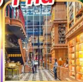
ร้านไอศกรีมมियाฮาร่า