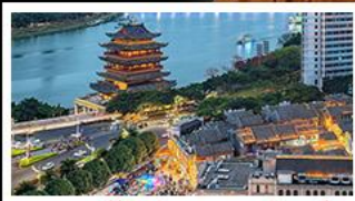
ถนนคนเดินสามตรอกสองซอย