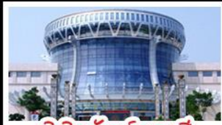
พิพิธภัณฑ์กังวาลสี

สวนสนุก FANTASYLAND - หมู่บ้านสไตล์ยุโรป พิพิธภัณฑ์กังวาลสี - ถนนคนเดินสามตรอกสองซอย ท่าเรือกิ่งจื่อ - ศาลเจ้าแม่กวนอิมพันกร เมนูพิเศษ อาหารกังวาลตุ๋น , สุกีชาบูหม่าล่า