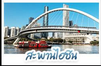
สะพานโพฮง

บิตรงกว้างใจ • จัดเต็มเที่ยวสวนสนุกกลางหลงเต๋มวัน เที่ยวจีนฟีลยุโรป ชมสถาปัตยกรรม ณ เกาะซาเมียน สักการะวัดพระใหญ่ พุกธูปเก่าแก่กว่า 1,000 ปี ใจกลางเมืองกว้างใจ เช็กอินกับแลนด์มาร์กสุดฮิตจิตรัสฮวาเจิงท่าฮูกับหอทีวี ฮ้อปบิงเฟลีน ถนนคนเดินอีโต้และถนนคนเดินบักกิง