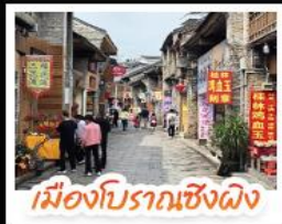
เมืองโบราณเซียงผิง

เช็คอินจุดไฮไลท์กุ้ยหลิน เจดีย์เงินเจดีย์ทอง เวางวงช้าง นั่งเคเบิลคาร์สู่ เทาหลู้อี จุดชมวิวกะลาภูเขา แห่งเมืองหยางซั่ว ล่องเรือแม่น้ำลู่เจียง ตามรอยช้างหลังภาพรมบัตร 20 หยวน อิสระช้อปปิ้งถนนคนเดิน 2 แห่ง ถนนดงซีเซียง ถนนซีเจีย นั่งกระเช้าบอลลูนชมวิวกว๊าน 360 องศา