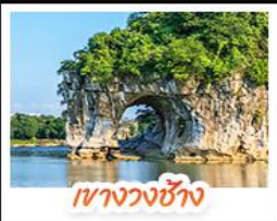
เขางวงช้าง