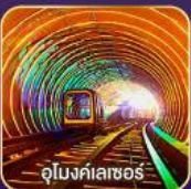
อุโมงค์เตาเซอ์