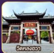
วัดหลงอวา