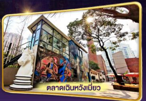
ตลาดเงินหวังเมี่ยว