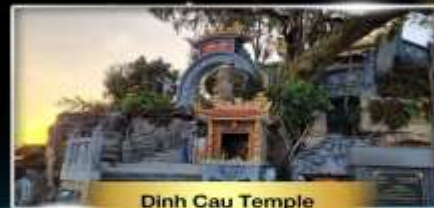
Dinh Cau Temple