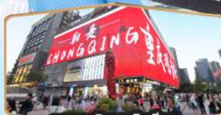
ถนนคนเดินถวณอันเฉียว