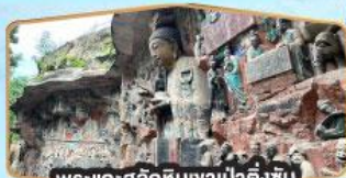
พระแกะสลักหินงาป่าตึงซัน