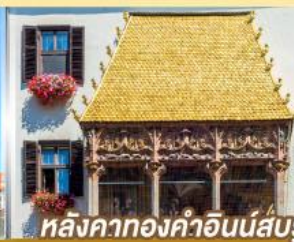
หลังคาทองคำอินน์ส์บรุค