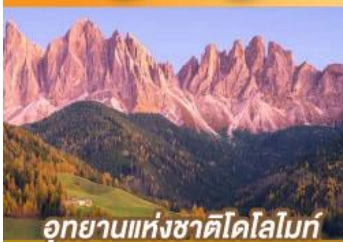
อุทยานแห่งชาติโดโลไมท์

บั้นตรงนครอัมสเตอร์ดัม กับเส้นทางสายโรแมนติก พร้อมการแสดงพื้นบ้านสไตล์ที่โรเลียนสุดพิเศษ