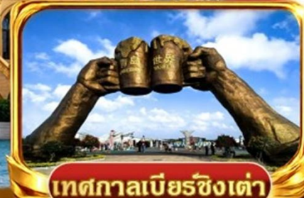
เทศกาลเบียร์ชิงเต่า