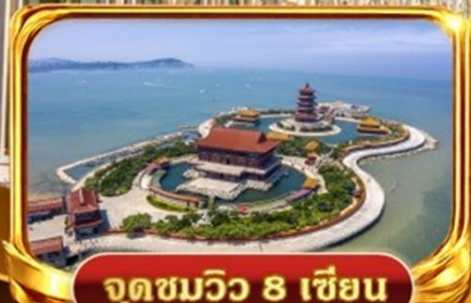
จุดชมวิว 8 เชียง