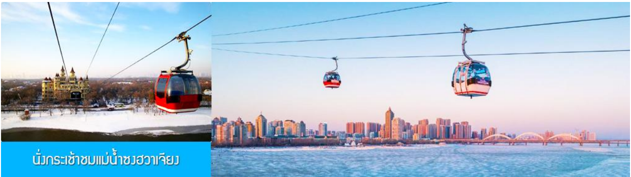
นั่งกระเช้าชมแม่น้ำซวงเวาเจียง

พักที่ VIENNA INTER HOTEL โรงแรมระดับ 4 ดาวท้องถิ่น ในเมืองเมืองซ่งจี้