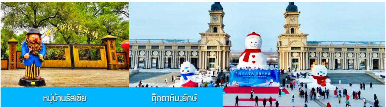
หมู่บ้านรัสเซีย

นำท่าน นั่งกระเช้าชมความสวยงามของแม่น้ำซวงเวาเจียงในฤดูหนาว 乘缆车跨越松花江 แม่น้ำสายหลักที่ไหลผ่านเมืองฮาร์บิน ในช่วงฤดูหนาวน้ำในแม่น้ำซวงเวาจะกลายเป็นลานน้ำแข็งขนาดใหญ่และปกคลุมด้วยหิมะ ชม หมู่บ้านรัสเซีย 俄罗斯小镇 ชมบ้านเรือนและรีสอร์ทสไตล์รัสเซียรวม 27 หลังภายในหมู่บ้านเล็ก ๆ แห่งนี้ ตั้งอยู่บนเกาะพระอาทิตย์ 位于太阳岛上 เมื่อนักท่องเที่ยวมาเยือนในหมู่บ้านเสมือนท่านกำลังเดินเล่นอยู่ในหมู่บ้านหนึ่งใน รัสเซีย