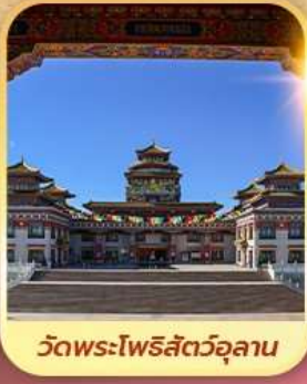
วัดพระโพธิสัตว์อูลาน