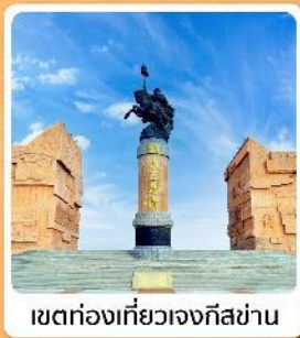
เขตท่องเที่ยวเจงกิสข่าน