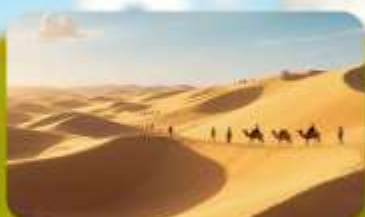
เนินทรายอินเคินทาลา