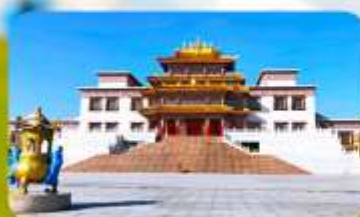
คฤหาสน์พุทธบูชาแห่งชีวิคูลาน