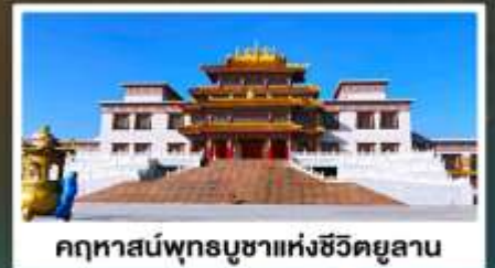
คฤหาสน์พุทธบูชาแห่งชีวิตยูลาน