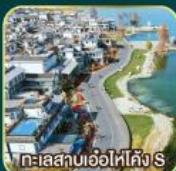
ทะเลสาบเอ๋อไห่คัง S