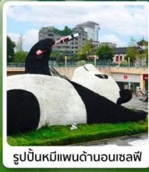
รูปปั้นหมีแพนด้าบนตึก IFS