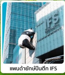
แพนด้ายักษ์บนตึก IFS