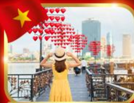
เช็กอินสะพานแห่งความรัก