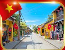
เมืองมรดกโลก ฮอยอัน