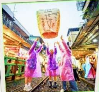
ปล่อยโคมลอย