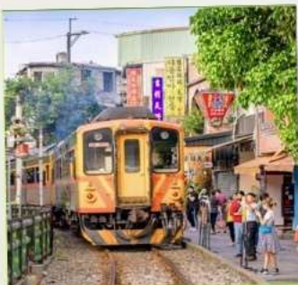
สถานีรถไฟซือเฟิ่น