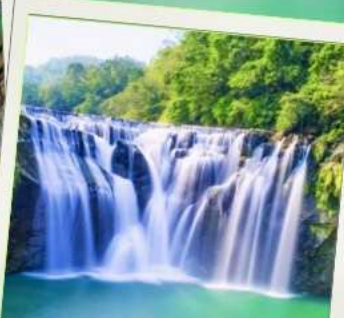
น้ำตกซือเฟิ่น